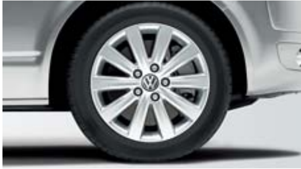
17英寸铝合金轮毂 “Neva” 7J X 17, 235/55 R17 轮胎