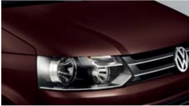
11 暗木黑 珠光漆 P3