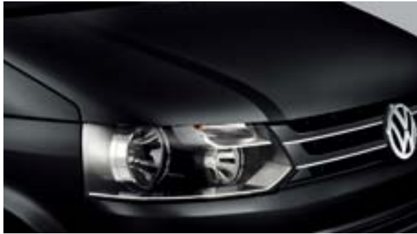
10 深黑 珠光漆 2T