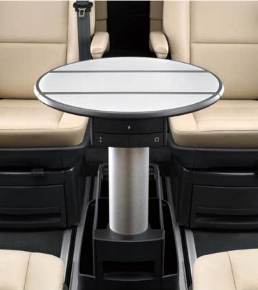
多功能桌 圆形桌面，多个抽屉，设计感与功能性完美兼顾。欲收起，可将桌面旋转 90 度，折叠后变为第二排座椅的中央扶手。多功能桌可沿单人座椅之间的两个附加的中心轨道滑动。