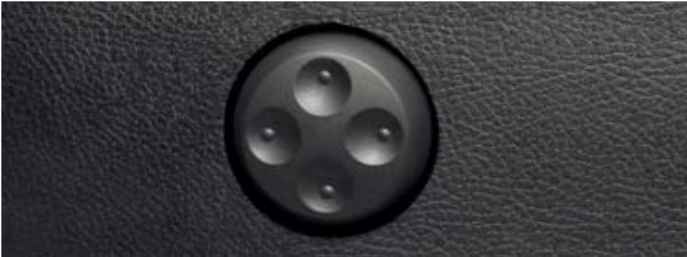
舒适座椅 高度可调的人体工程学座椅，装备扶手和腰部支撑。标配的驾驶员座椅的腰部支撑也可进行电动调节。