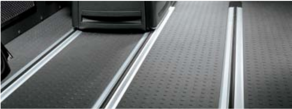
四轨系统 根据要求，不论三人座的座椅或每个后排独立座椅及多功能桌均可轻松连接到地轨，流畅滑动到位。