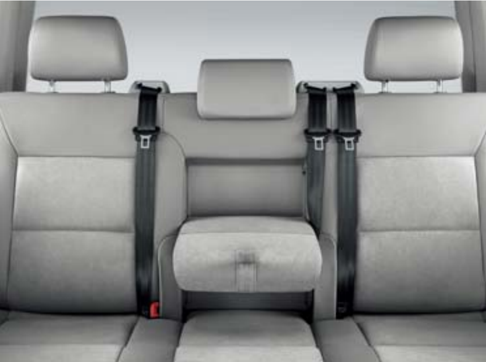
后排中间扶手 后排中间扶手和三座连体座椅融为一体。放下扶手，令后排座乘坐更加舒适。

迈特威高档的多功能内饰装备与简洁大方的外观造型相得益彰。所有座椅与内饰色调浑然一体；高级柔韧的材质，匹配精湛工艺，舒适氛围犹如豪华且高档的商务会所。