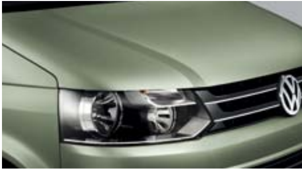
09 清凉绿 金属漆 3P