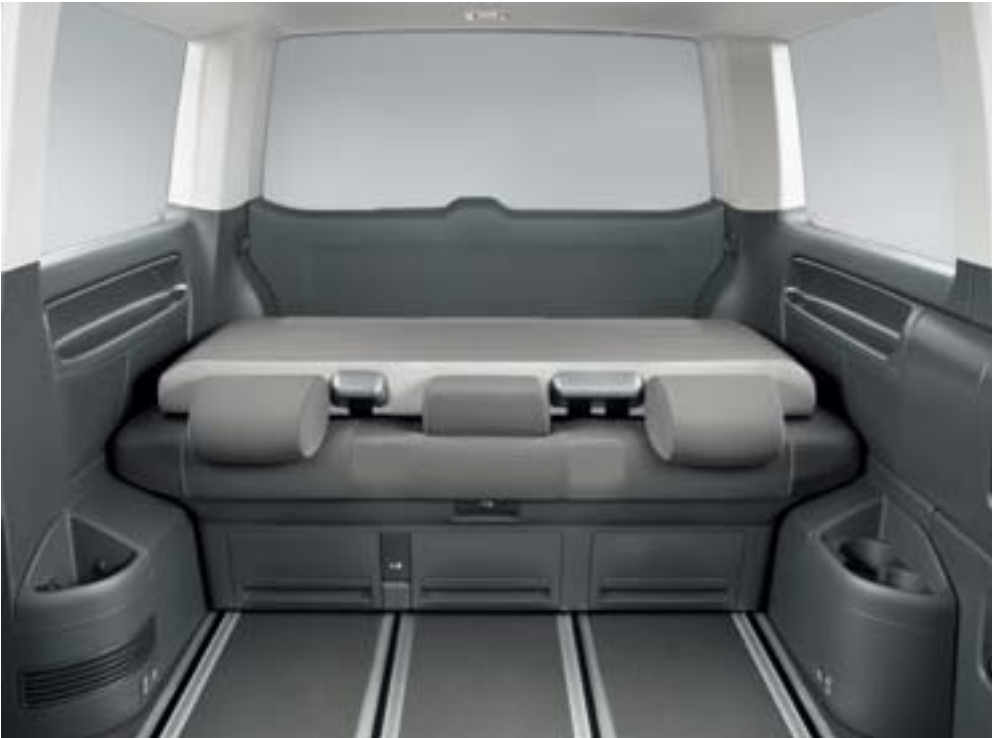
“Alcantara”或“Nappa”真皮三座连体座椅 椅背向下折叠，可为行李和后备箱释放更多空间。