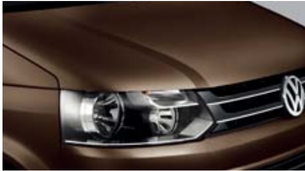
08 太妃褐 金属漆 4Q