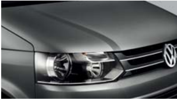
07 天然灰 金属漆 M4