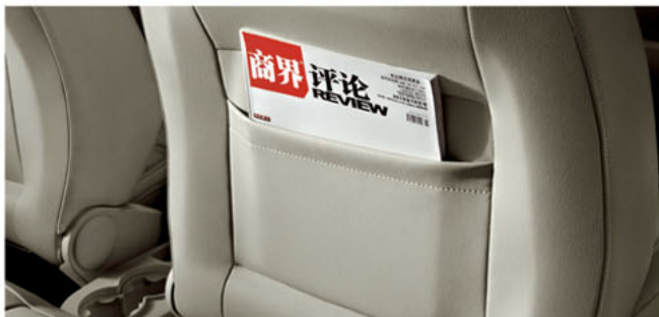
前排座椅背部储物袋