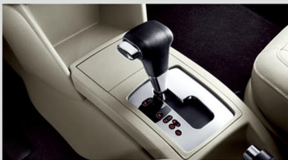
Tiptronic 六档手自一体变速箱

着力当下，更着眼未来，这就是你更具雄心的进取之道。Polo 新劲取配备 Tiptronic 六档手自一体变速箱，以领先操控畅行无界，悦听多功能音响系统及变排量智能温控空调等人性科技乐享随行。一路动力澎湃，Polo 新劲取给生活激情，让人生快意。