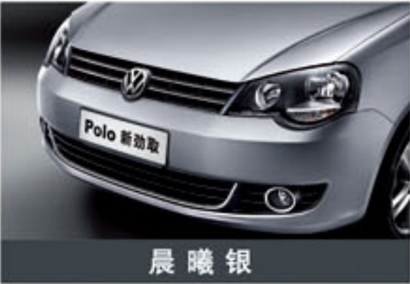
晨 曦 银