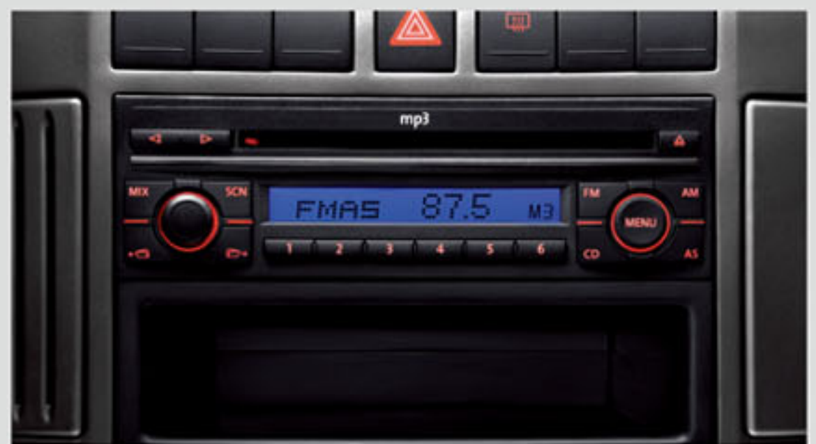
悦听多功能音响系统