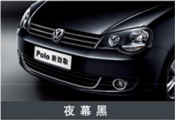
夜 幕 黑