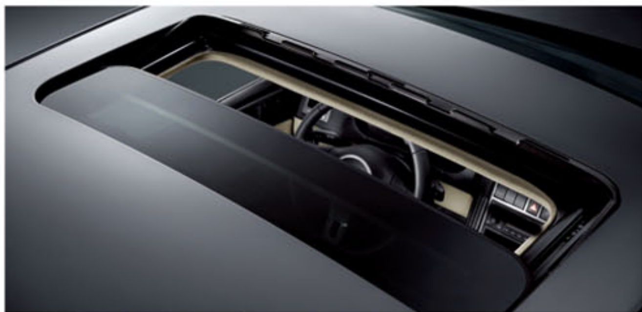
双开启式防夹电动天窗

实用而兼具格调，工艺与艺术交融，无论明朗雅黑大中控台，还是纯雅质感内饰，实尚设计理念皆贯彻其中，双开启式观景天窗开阔心境，更丰富的储物空间便捷实用。生活要品质，更要有品位，这就是 Polo 新劲取的实尚观。