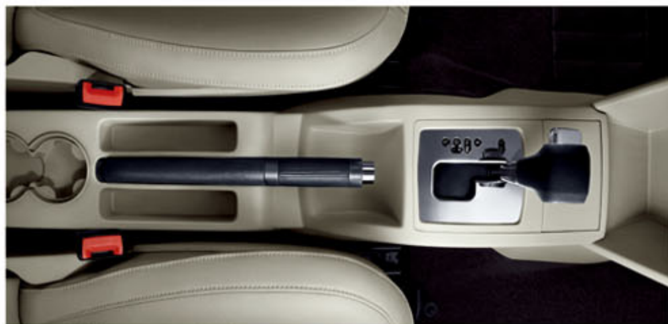
皮质速捷手刹（选装）