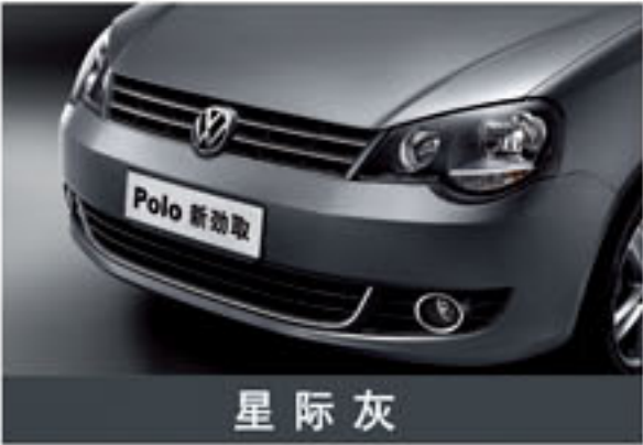
星 际 灰

声明: 1) “●”表示有此装备, “—”表示无此装备, “○”表示选装 2) 本清单的全部内容请以实车为准, 若出现以下情况 (包括但不限于): 国家相关法律法规的强制要求, 技术进步, 产品更新和零部件供货调整等, 上海大众汽车有限公司保留对产品价格、外观颜色、技术参数、配置装备和车型代号等信息的修改权利。