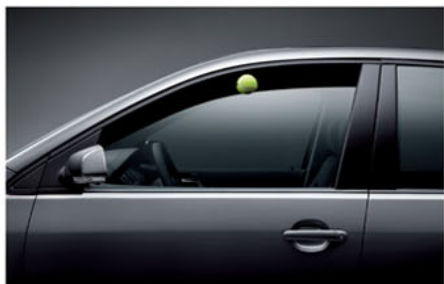
前门车窗一键式升降带防夹功能