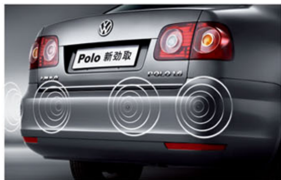
自侦测数字式倒车雷达 PDC