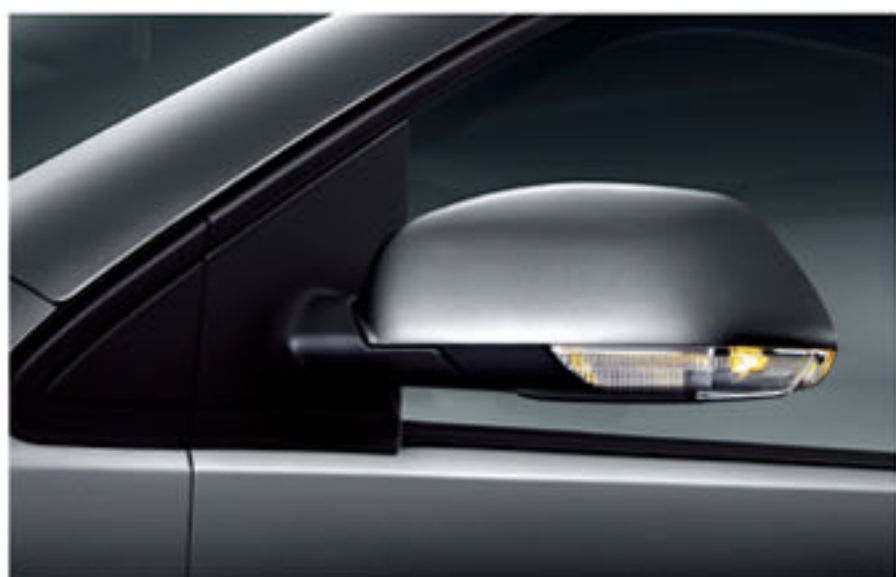
电动可调, 可加热外后视镜