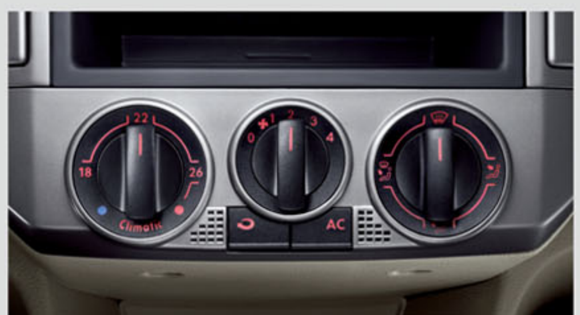
变排量智能温控空调