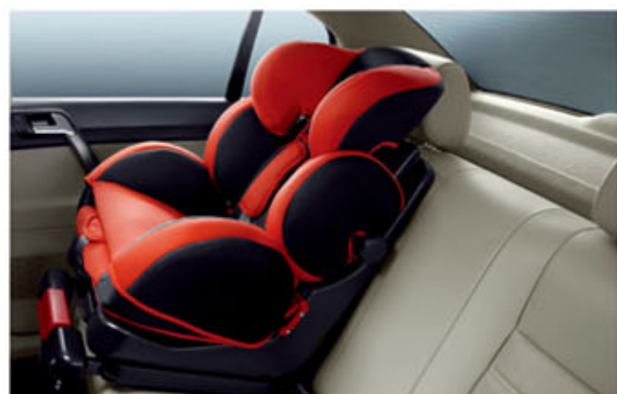
儿童座椅同步安装装置 (ISO FIX)