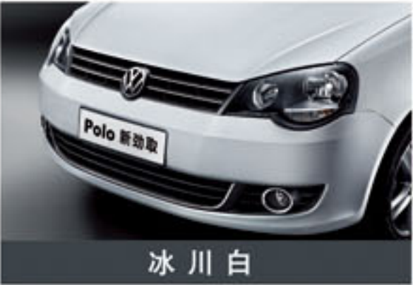
冰 川 白