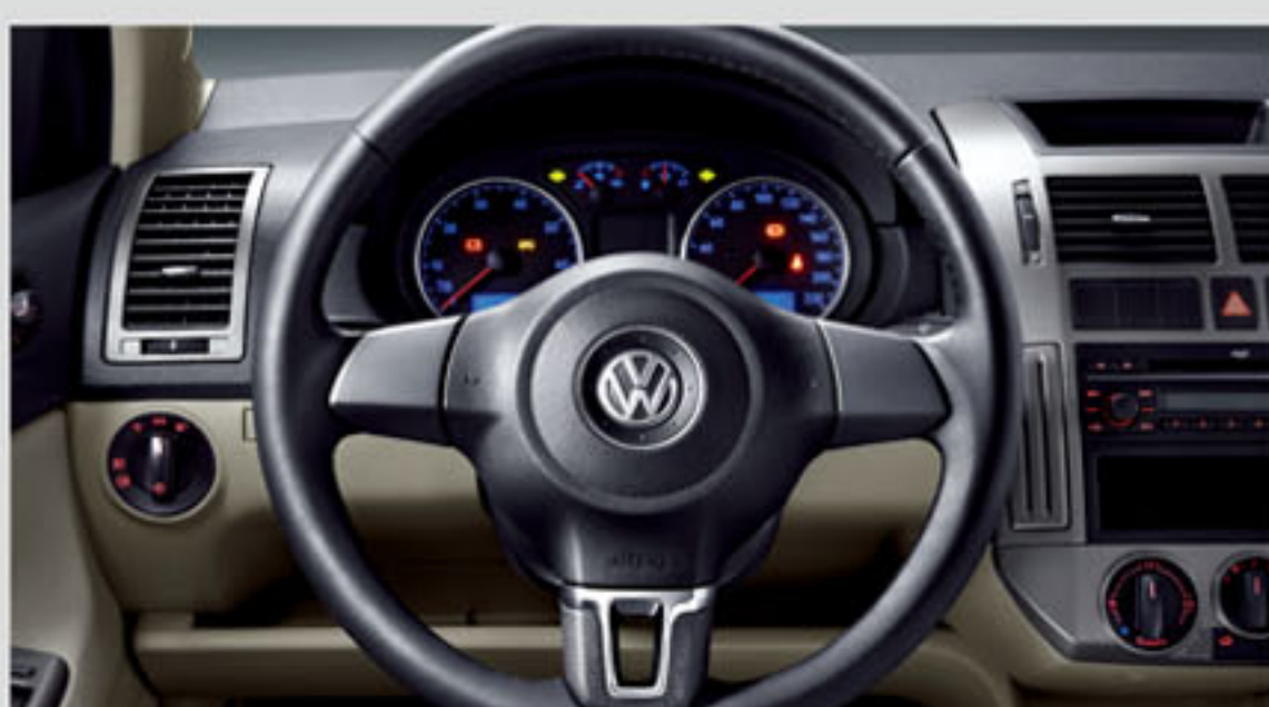
动感真皮三辐方向盘（选装）