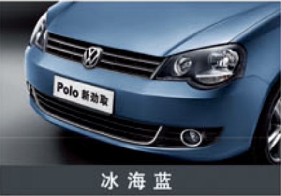
冰 海 蓝