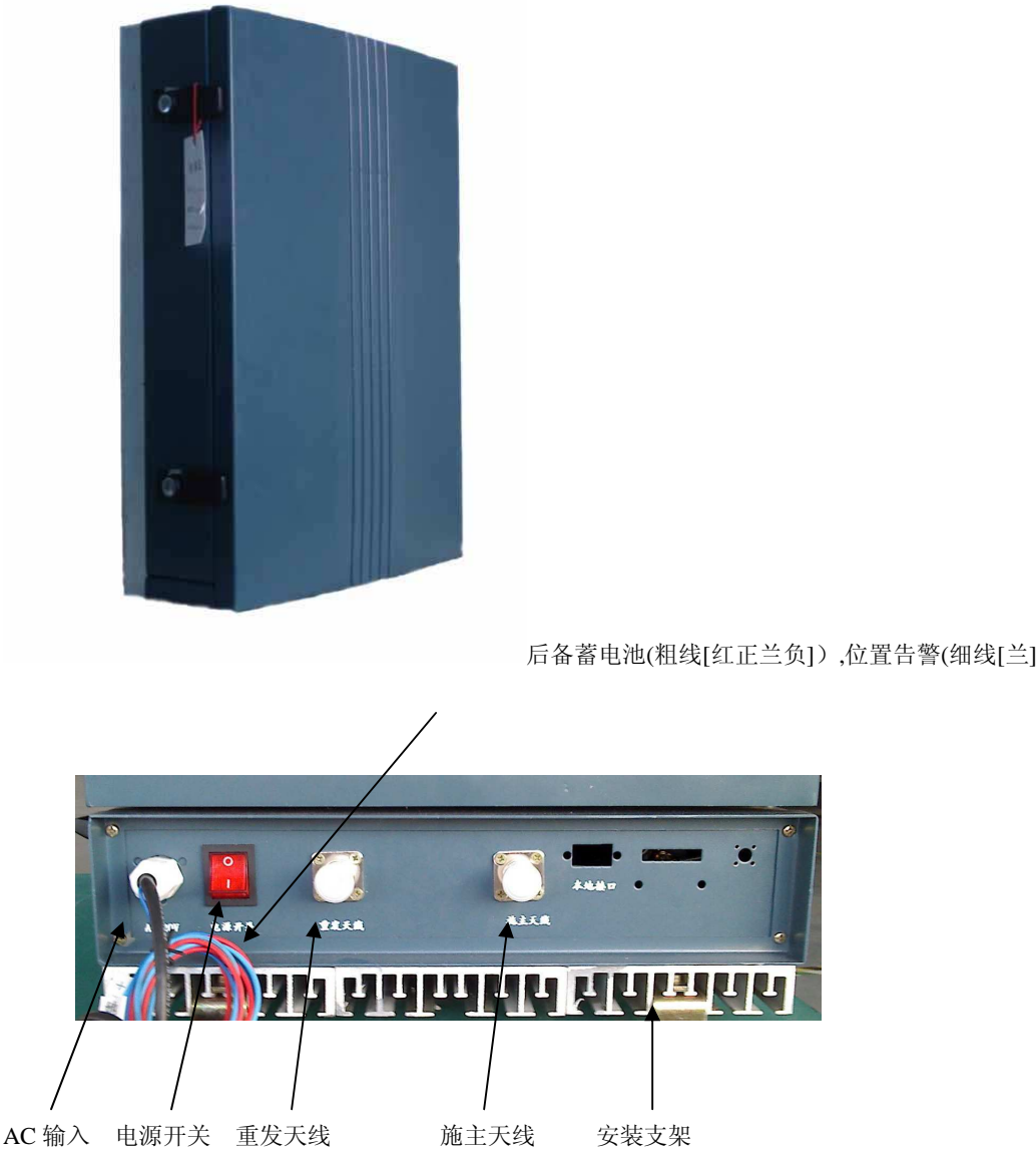
图 7-1 箱体外型说明